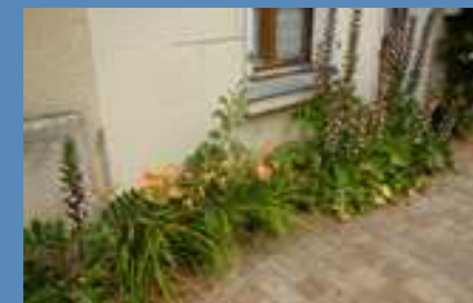
La végétalisation des trottoirs doit être plus généreuse qu'aujourd'hui. Ici un exemple dans peu de largeur de terre.