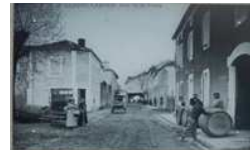
Une architecture en lien avec la vigne