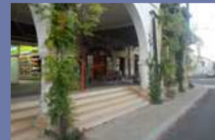
Des plantes grimpantes à généraliser sur le linéaire du «jardin de la vigne», rues du Village Neuf et Saint Jean