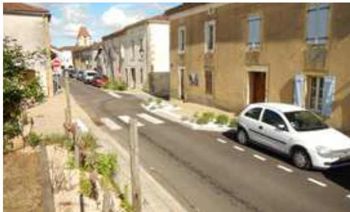
Le jardin médiéval est peu perceptible depuis la place. L'aménagement de la rue doit inviter le visiteur à le découvrir. l'ensemble des 9 carrés