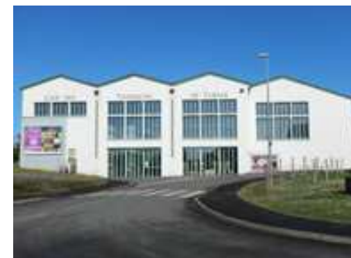
La cave des vignerons de Tursan à l'entrée Sud - Ouest de la Cité