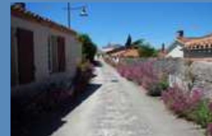
Une rue qui ne ressemble pas à une route invite à la parcourir à pied.