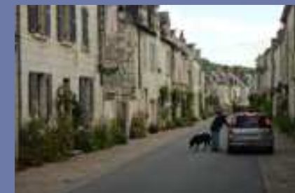
La végétalisation des façades renforce la lecture d'un espace apaisé où la voiture ne fait que passer