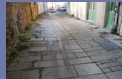
Un changement de matériau de sol pour signifier la zone piétonne débouchant sur la place de la Bastide