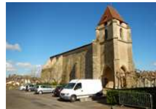
La rue du Village Neuf met en lien plusieurs éléments patrimoniaux dès l'entrée dans la Bastide