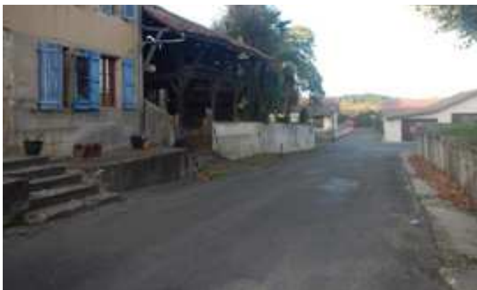
Une rue aujourd'hui très marquée par le béton et l'enrobé. Le patrimoine architectural n'est pas mis en valeur