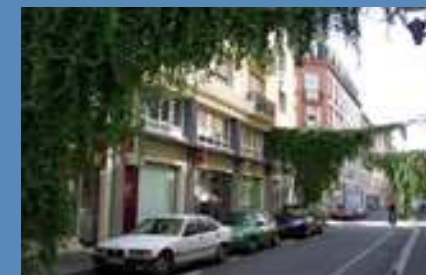
Les treilles et pergolas peuvent surplomber la rue.