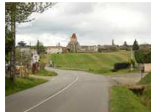
L'entrée Nord - Est de la Cité doit permettre aux visiteurs de comprendre qu'ils sont au cœur du Tursan

Nous proposons donc de redonner du lien entre le patrimoine et l'activité viticole au travers du réaménagement de la rue du Village Neuf et de la rue Saint-Jean, et d'en faire une sorte de cordon ombilical entre l'intérieur et l'extérieur de la bastide, une forme de support principal d'un parcours de découverte autour de la thématique du patrimoine, enrichie par la thématique viticole.