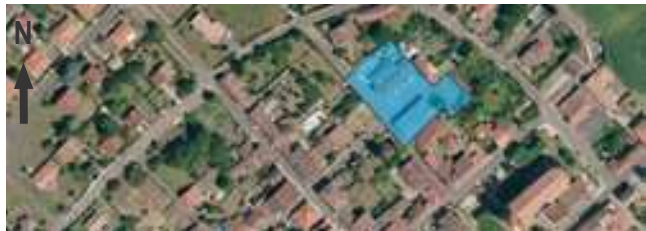
1. Les ateliers municipaux - la halle aux veaux