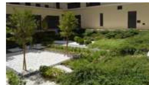
Inspiration pour l'aménagement de cœur d'îlot de la mairie... un usage mais aussi une promenade et un repos.