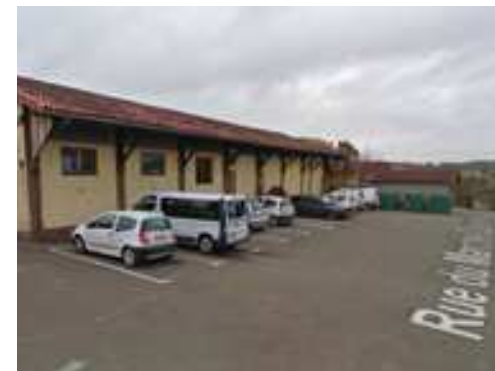
Les abords des ateliers municipaux : une rupture dans la perception de la structure urbaine de la Bastide.

L'intégration de la voiture dans la structure urbaine a depuis les années 50 perturbé progressivement la structure des espaces publics des sites au gisement patrimonial. Quel équilibre à trouver pour prolonger l'imaginaire par la découverte en situation de piéton tout en favorisant un ordinaire acceptable par l'habitant ?