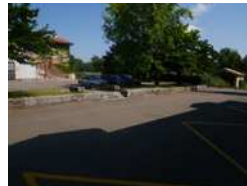
Les abords de la poste et de la tour des Augustins : Placette ou Parking

On se doit d'être vigilant pour le projet de l'installation de la résidence senior. Il s'agira de maintenir le dessin strict de l'îlot (alignement des façades) tout en intégrant des capacités de stationnement pour les résidents et les visiteurs. Cet espace doit aussi être en mesure de recevoir un jardin à destination des habitants de l'îlot mais également des usagers de la cité.