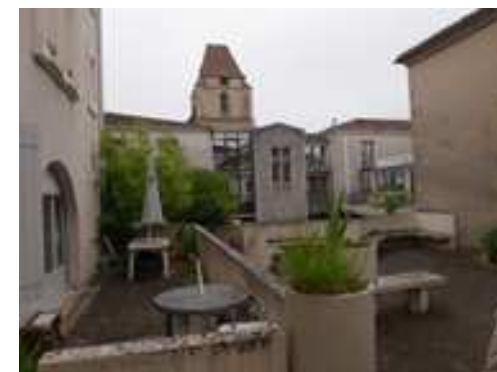
Le cœur d'îlot de la mairie : un espace à rendre accueillant et participant de la découverte de la Cité.

Cependant, la recomposition du bâtiment municipal sous-entend que l'on trouve un autre lieu pour l'accueil des ateliers (La zone d'activités pourrait être propice à l'accueil d'un tel équipement qui nécessite des espaces de stockage de matériaux). En tout état de cause, la placette peut d'ores et déjà faire l'objet d'une requalification en associant les habitants et les services techniques de la commune.